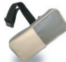
300 (в) X 140 (ш) X 40 (толщ.) мм

■ Футляр (продается отдельно) Модель №/ НМ-818 Сумка с поясом (на талию)