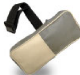
300 (в) X 140 (ш) X 40 (толщ.) мм

Футляр (продается отдельно) Модель №/ НМ-818 Сумка с поясом (на талию)